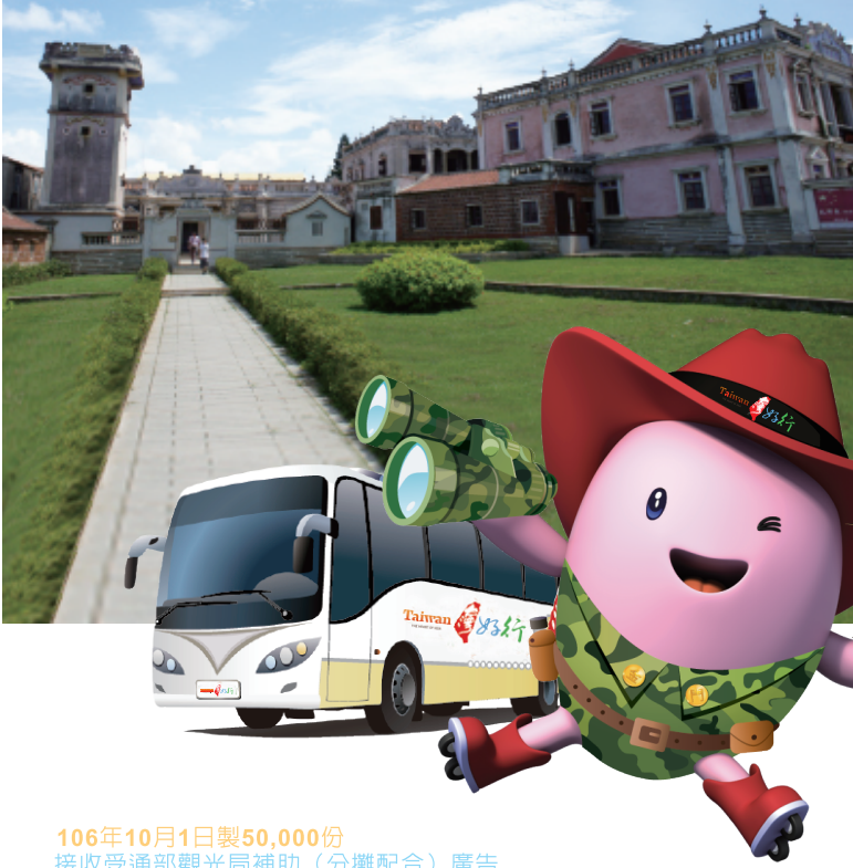
106年10月1日製50,000份 接收交通部觀光局補助(分攤配合)廣告